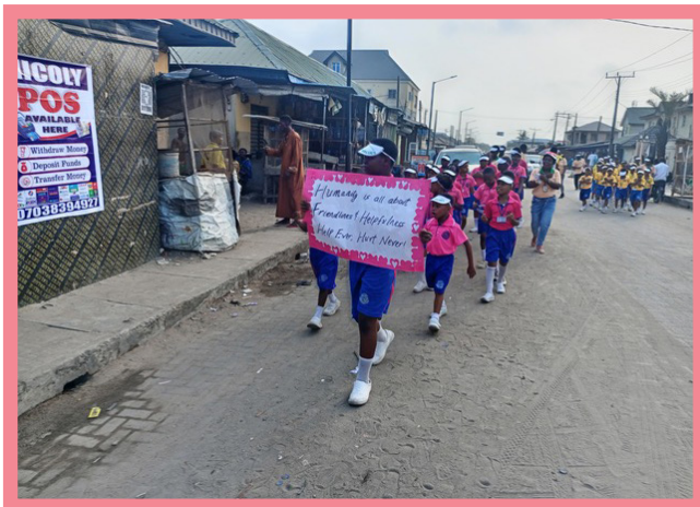
Op 12 februari 2024 liepen kinderen van de Sathya Sai School van Lagos, Nigeria, door hun dorpen met kleurrijke posters en zongen zij liedjes over de waarden.