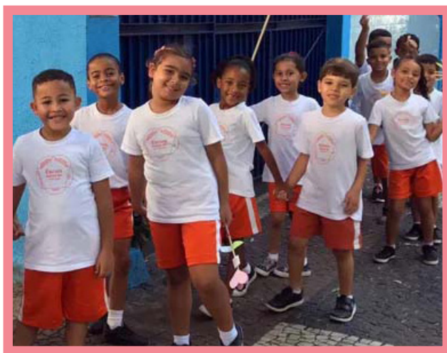
Op 23 april 2023 liepen kinderen van de Sathya Sai School van Vila Isabel in Rio de Janeiro, Brazilië, in hun buurt en maakten ze de toeschouwers blij tijdens een opwekkende Loop voor Waarden!