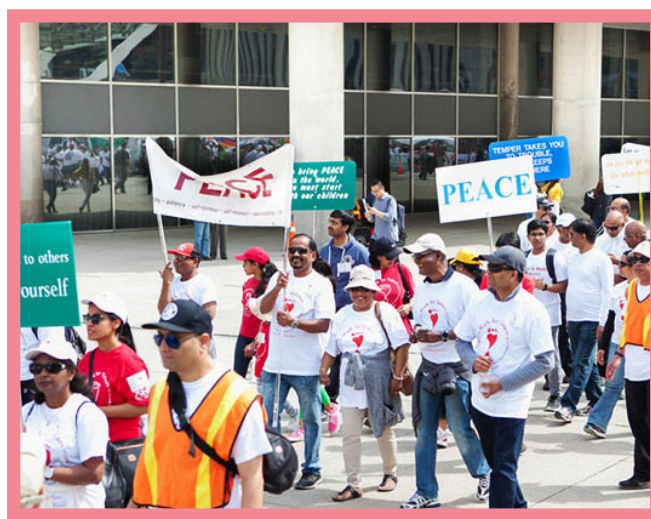
Op 24 april 2024 liepen, zoals elk jaar, leerlingen van de Sathya Sai School in Toronto, Canada, voor Waarden. Voorafgaand aan het evenement deden ze een zelfevaluatie om te bepalen welke waarde nodig was om te oefenen voor persoonlijke groei en ze beloofden dit gedurende het jaar te doen.

Op https://walkforvalues.com/lth vindt u meer informatie en praktisch advies om welzijn en betere onderwijsresultaten te bevorderen.