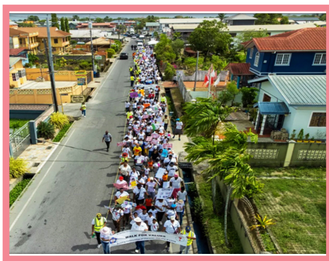
Op 6 mei 2023 organiseerden 5 Sathya Sai Scholen in Trinidad en Tobago hun eerste Loop voor Waarden- en Milieumarkt. Het thema van het evenement waaraan meer dan 350 mensen meededen, was "Bouwen aan een samenleving met Karakter, één stap tegelijk".