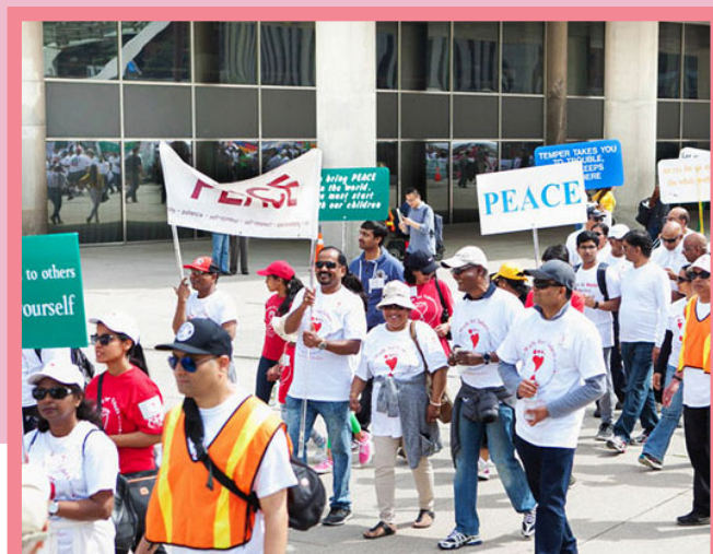
Le 24 avril 2024, comme chaque année, les élèves de l'École Sathya Sai de Toronto, au Canada, ont marché pour les Valeurs. Avant l'événement, ils ont fait une auto-évaluation pour déterminer la valeur qu'ils devaient pratiquer pour leur propre croissance et ont pris l'engagement de la faire durant l'année.

L'initiative doit son lancement à l' École Sathya Sai du Canada , dont la première Marche pour les Valeurs a eu lieu en 2003 dans la communauté de Malvern, au nord-est de Toronto, en Ontario. Depuis lors, plusieurs provinces, dont l'Alberta, la Colombie-Britannique, le Manitoba, le Nouveau-Brunswick, la Nouvelle-Écosse et Terre-Neuve-et-Labrador, ont répondu à l'appel de "passer de la parole aux actes!" (Walk our Talk!), car "la pratique mène à la perfection"! Vous pouvez en savoir plus sur : https://walkforvalues.com