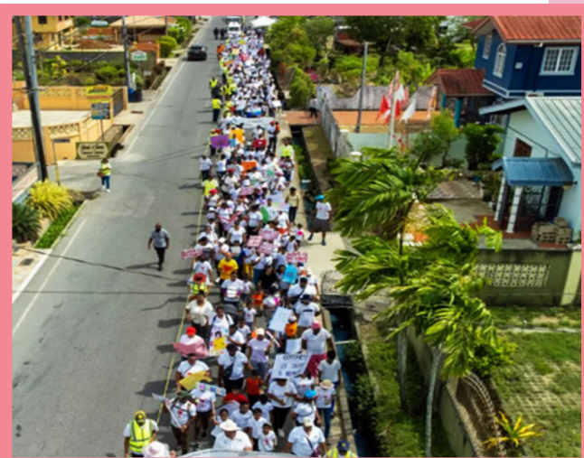
Le 6 mai 2023, cinq écoles Sathya Sai de Trinité-et-Tobago ont organisé leur première Marche pour les Valeurs et Foire Environnementale. Le thème de l'événement, auquel ont participé plus de 350 personnes, était « Construire des Communautés de Caractère, Un Pas à la Fois ».