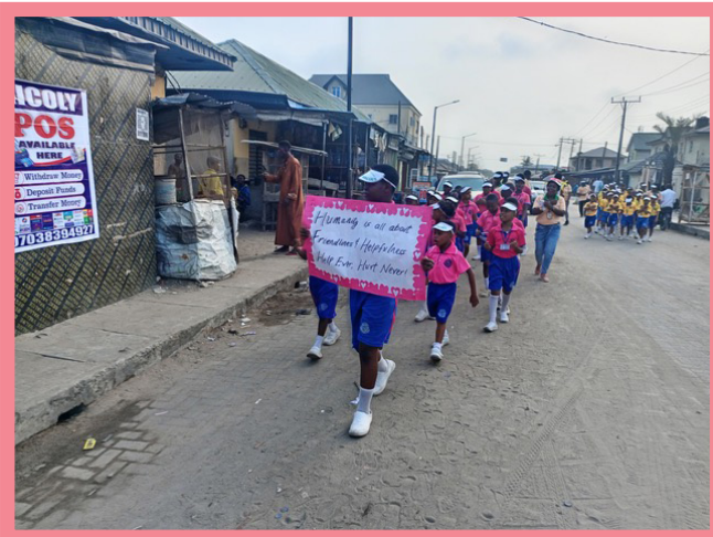
Il 12 febbraio 2024, i bambini della Scuola Sathya Sai di Lagos, in Nigeria, hanno attraversato a piedi i loro villaggi portando cartelli colorati e cantando canzoni sui valori.