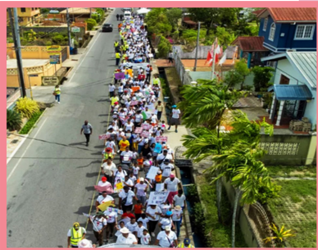
Il 6 maggio 2023, cinque Scuole Sathya Sai di Trinidad e Tobago hanno organizzato la loro prima Marcia per i Valori e la Fiera Ambientale. Il tema dell'evento, a cui hanno partecipato oltre 350 persone, era "Costruire Comunità di Carattere, un Passo alla Volta".