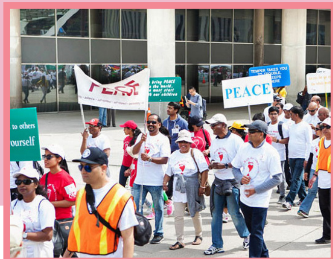
Il 24 aprile 2024, come ogni anno, gli studenti della Scuola Sathya Sai di Toronto, in Canada, hanno Marciato per i Valori. Prima dell'evento hanno fatto un'autovalutazione per determinare il valore da praticare per la crescita personale e si sono impegnati a farlo durante l'anno.

Per maggiori informazioni visitare il sito: https://walkforvalues.com