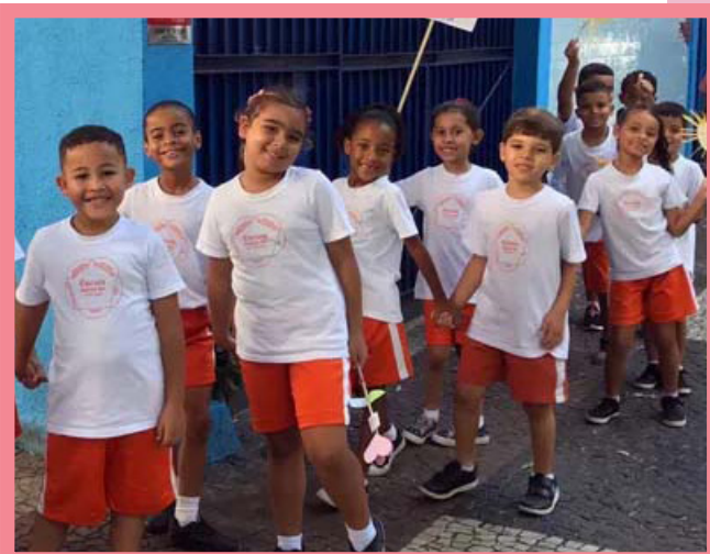
Il 23 aprile 2023, i bambini della Scuola Sathya Sai di Vila Isabel a Rio de Janeiro, in Brasile, hanno allietato gli spettatori durante un'entusiasmante Marcia per i Valori nel loro quartiere!