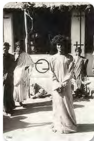
Imágenes cortesía de Sri R. Padmanabhan, de su libro Love is My Form.